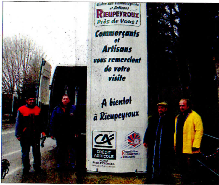
Les ouvriers et employés qui ont mis les totems en place.

écemment, se tenait l'assemblée générale de l'Union des Commerçants et Artisans de Rieupeyroux (UCAR). Une réunion que le bureau — reconduit — a souhaité conviviale puis- qu'elle se déroulait autour d'un repas au restaurant le Grill. Il a été question de la soirée du 30 avril « la nuit des commerçants » qui réunira commerçants et artisans du département adhérents autour de l'opération jeux des commerçants font le printemps » dont l'UCAR sera (jeu du 28 mars au 10 avril). Près de 100 personnes seront accueillies, salle d'animation de La Chapelle-Bleys, (cette manifestation n'est pas ouverte au public) tous les commerçants s'or-