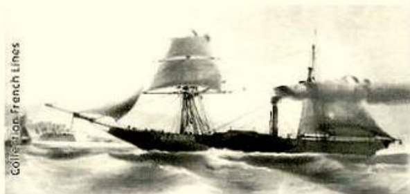
le paquebot Scamandre

Compagnie des Messageries Maritimes, 1851 - 1858