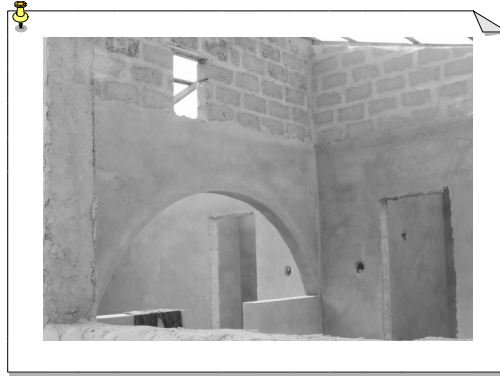
Depuis la fenêtre de la cuisine

Pourtant cette année j'aimerais vraiment qu'elles soient couvertes, car si les pluies durcissent le ciment, le soleil lui, fait travailler les poutres! Donc durant cette fin de mois le toit va être posé.