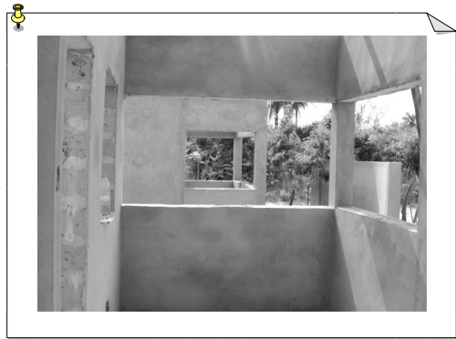
Depuis l'une des terrasses des petites cases

Pour voir la région, il y a Oussouye, un village qui a encore son roi. Et plus loin...Le Parc National de Basse Casamance à 10 km de là sur la route de Kabrousse. Il s'étend sur 5.000 ha jusqu'à la frontière de la Guinée-Bissau au sud. Dans une magnifique forêt de fromagers, manguiers, caïllédrats, irokos