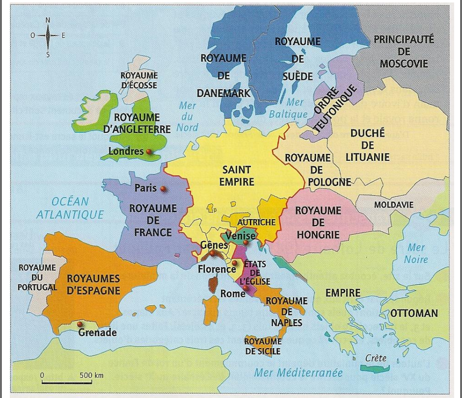
Document n°1 : Carte de l'Europe à la fin du Moyen-Age (XVème siècle).