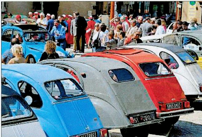
PLACE ANTONIN-CHASTEL. Après un tour dans la vieille ville (vallées des Usines, rues Durolle, de la Coutellerie), la cinquantaine de Deux chevaux se sont reposées devant l'hôtel-de-ville.

Avec une cinquantaine de Deux chevaux, pour la plupart de la région et des départements limitrophes, et 350 convives samedi soir à Saint-Rémy, le Lions club de Thiers a réussi son coup. Il lui reste aujourd'hui à faire ses comptes pour savoir