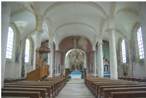
Nef et bas-côtés

Phase de conception : 2011 Maître de l'Ouvrage : Mairie de LINY-DEVANT-DUN Architecte du Patrimoine : M. Hugues DUWIG Coût des travaux : 580 000 € TTC